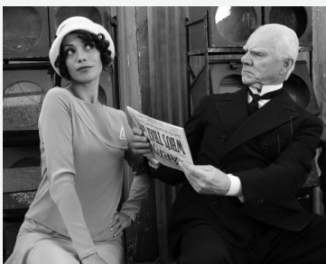
Un très digne monsieur assis dans les studios compare la photo du journal ("Who's that Girl?") à Peppy (Malcolm MacDowell)